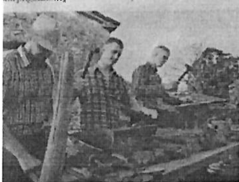
Posjetitelji su se mogli upoznati sa starim zanatima

U ovom su se Brgudu cijepala vuna, razvlačila vuna, mastio kapuz, šila i ručno prala roba i bio fažol, a Brgujci i njihovi gosti ponovo su se vratili u nekadašnja vremena svojih nona i nonića. U ovom su se Brgudu cijepala vuna, razvlačila vuna, mastio kapuz, šila i ručno prala roba i bio fažol, a Brgujci i njihovi gosti ponovo su se vratili u nekadašnja vremena svojih nona i nonića.