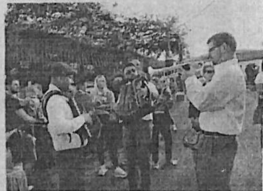
Nije izostala ni domaća muzika

Posebno gusto i prometo bilo je oko starinske kuhinje koju su vješto, bez prehtanja i njurganja, vodile vrijedne kuharice. Svačime su ponudile desetke ljudi koji su u njihovu kucu svratili, ali i objasnile kako se točno kuha i peče po brgujsku.