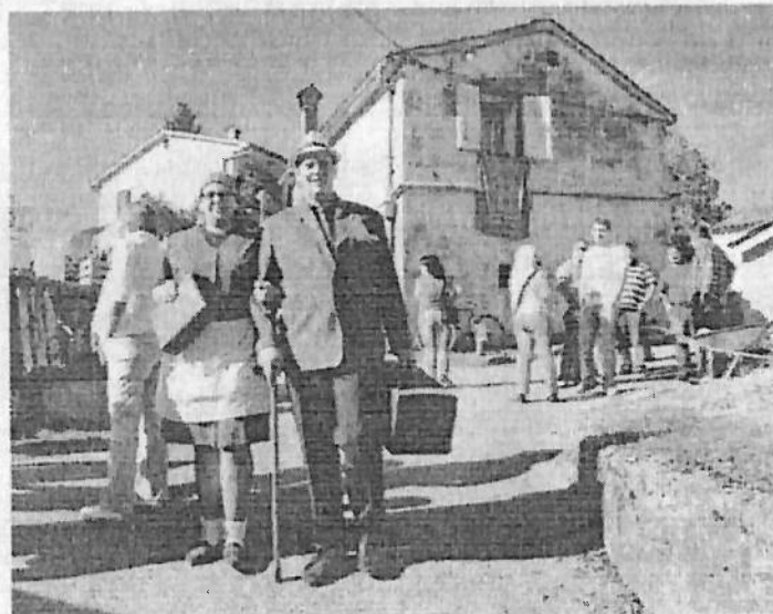
Dječiji Mankovi i jedna od vršnih manifestacija

Tko dođe u Veli Brgud ponovno će, kao i prošle godine, imati priliku vidjeti staru kuću s ognjištem i crnim zidovima, koja je gotovo u potpunosti zadržala svoju autentičnost. Također, tamo će biti predstavljene i brgujske narodne nošnje, koje su prošle godine ponovno izrađene i na taj način otrgnute zaboravu. Pored svega, moći će se zaplesati uz zvuk harmonika, popiti piće i okusiti domaću hranu. Posjetite ovu manifestaciju i osjetite kako su ljudi nekad živjeli u skladu s prirodom, koliko su bili jači međuljudski odnosi te kako je nekad vrijeme usporeno